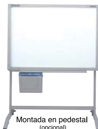
Montada en pedestal (opcional)