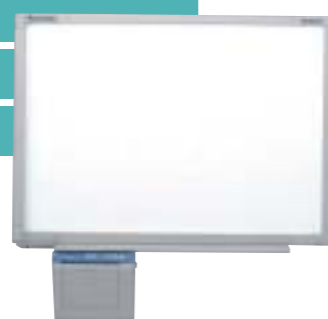
Montada en pared