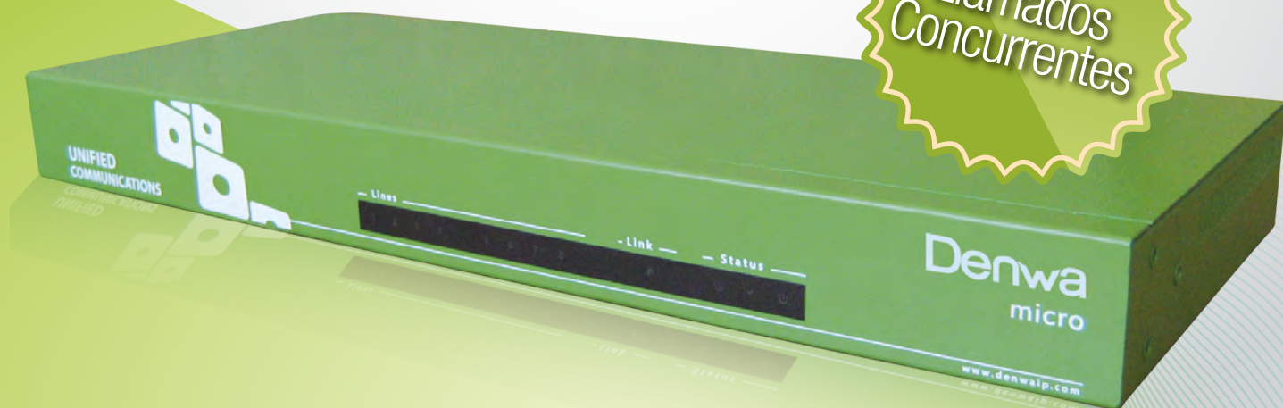
DENWA MICRO - FRENTE